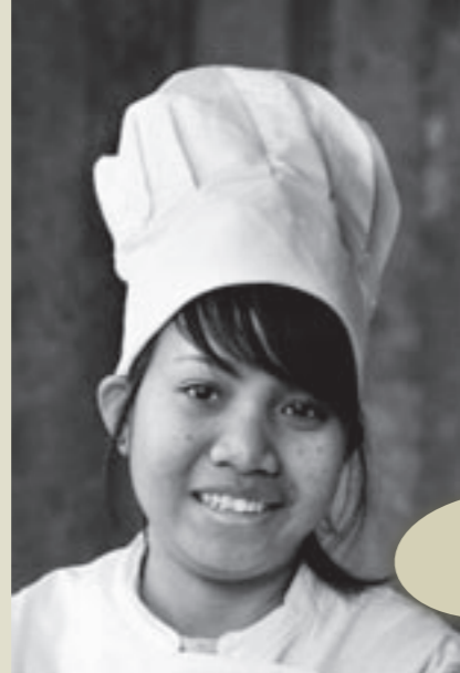
Legi, toekomstige kok